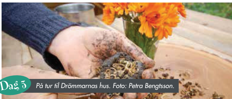
Dağ 3 På tur til Drömmarnas hus.

Herefter var det tid til at vende hjem med hovedet fuld af inspiration.