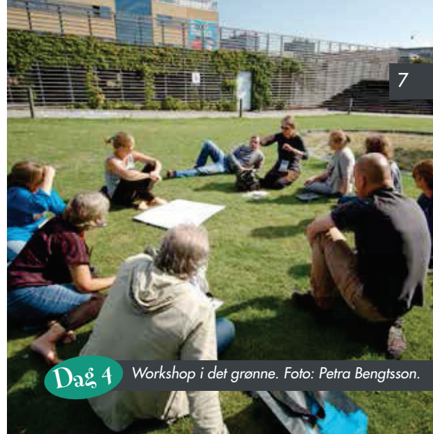
Dag 4 Workshop i det grønne.